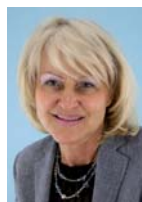
MVV Münchner Verlagsvertretung